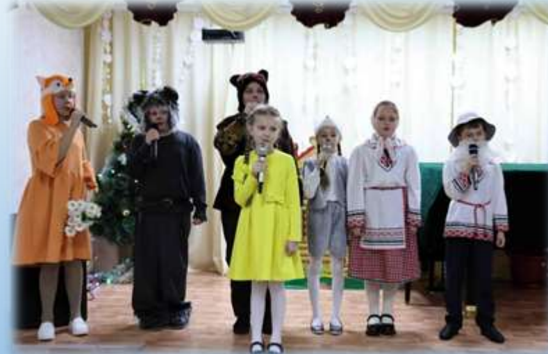
«Мы спасаем Колобка»