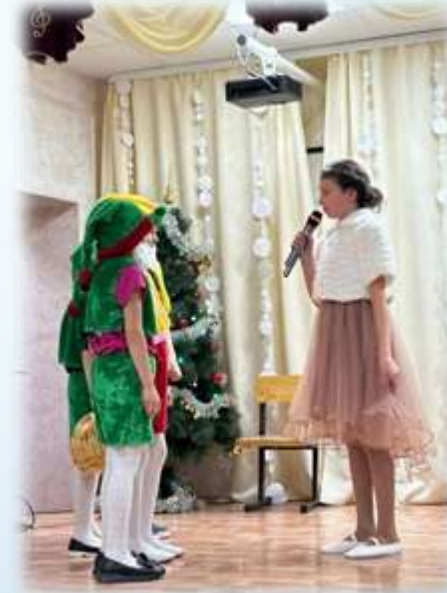
«Белоснежка и Леший»